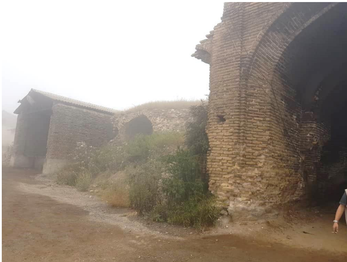
تصویر شماره ۱