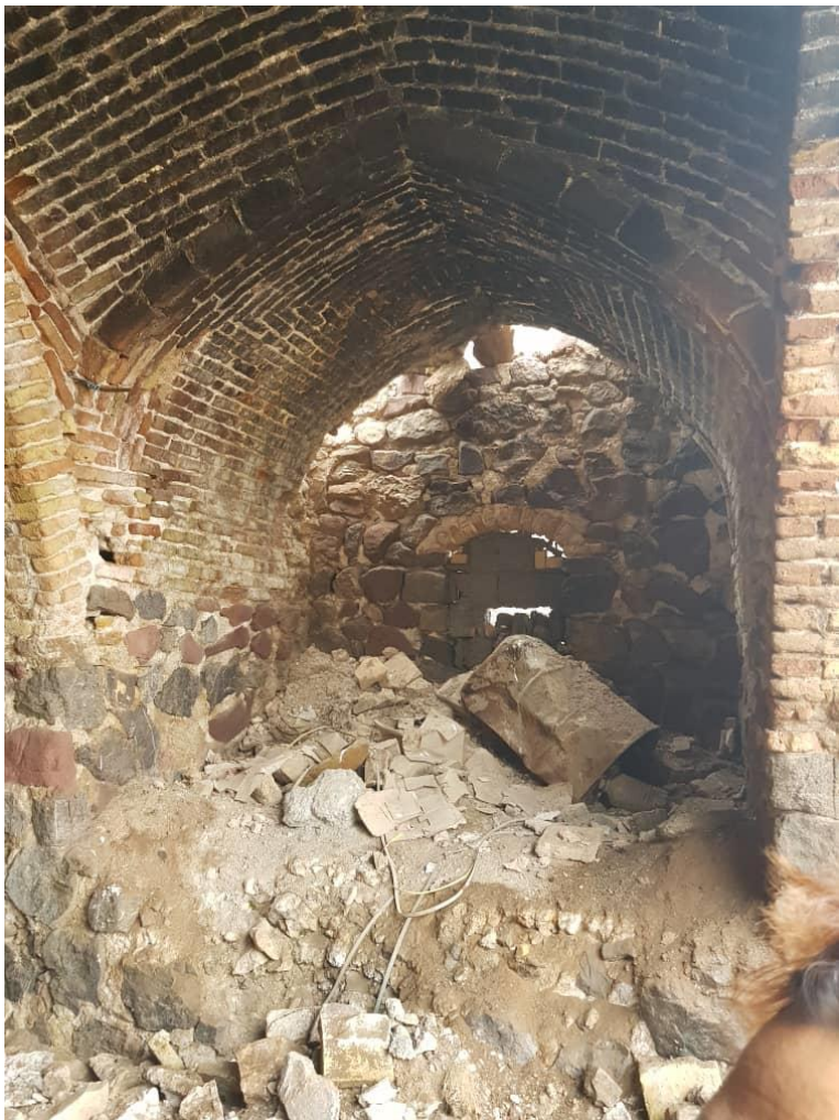
تصویر شماره ۵