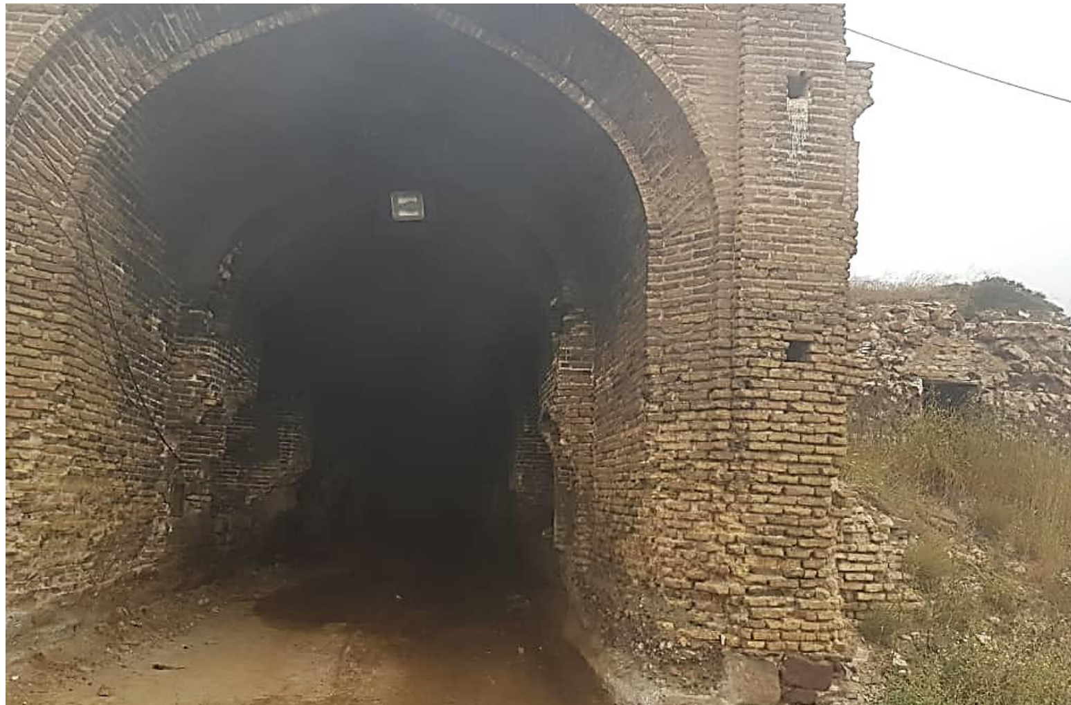
تصویر شماره ۶