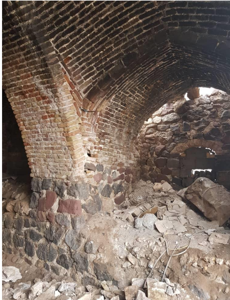
تصویر شماره ۴